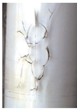
Haarrisse entstehen z.B. durch chemische Reinigungsmittel